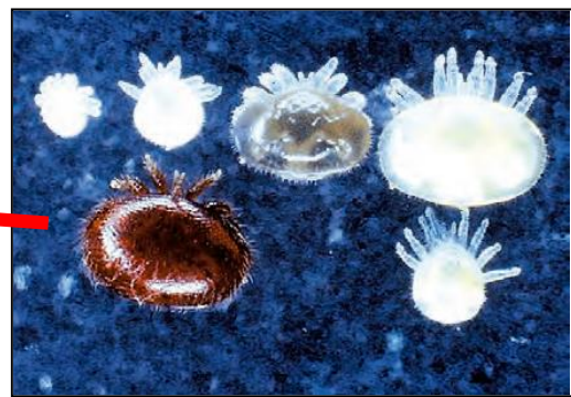
ミツバチヘギイタダニ